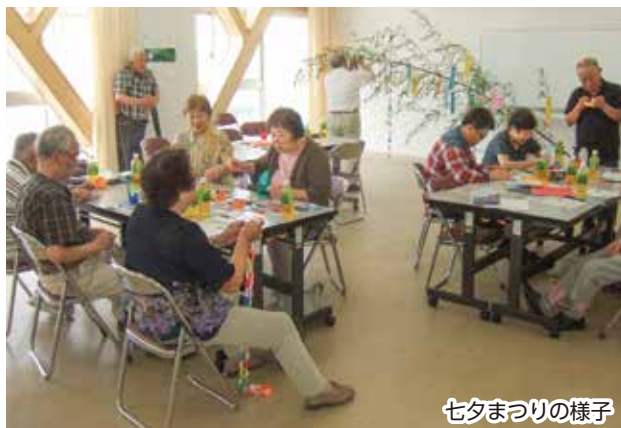
七夕まつりの様子

内容は、保健師による体調チェック、健康体操、支部では趣向を凝らしたゲーム、合唱、季節に応じた催しや、年2回、外出訓練としてバスハイイクに出かけるなど、いきいきと活動を続けています。