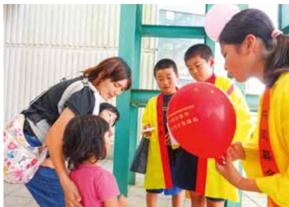
季美の森小学校児童（イオン大網白里店）