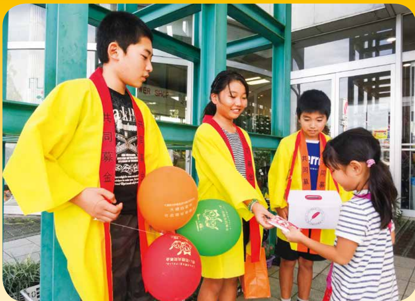
街頭募金：季美の森小学校（イオン大網白里店）