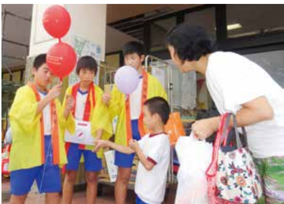
瑞穂小学校児童（主婦の店大網店）

昨年度に引き続き、瑞穂小学校、季美の森小学校と瑞穂支部社協・山辺支部社協にご協力いただき、10月5日（水）に主婦の店大網店、10月6日（木）にイオン大網白里店及びショッピングセンターアミ